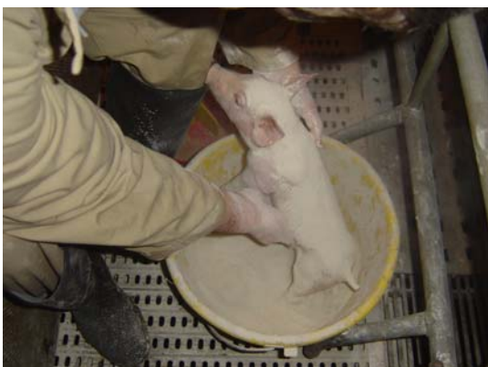
Figura 3 – Aplicação de Mistral ® após Nascimento