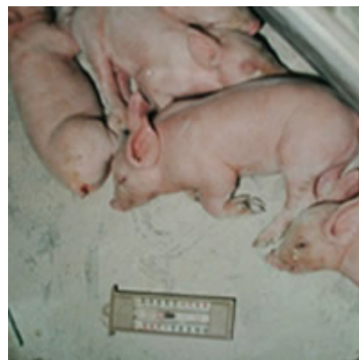
Figura 2 – Leitões com Mistral ® no ninho