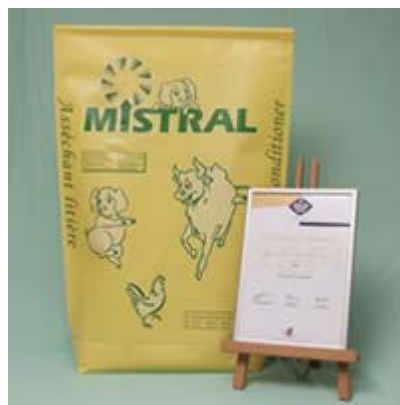
Figura 1 – Embalagem de Mistral

A aplicação de Mistral nas explorações permite bloquear os maus odores, captando e absorvendo o gás de amoníaco. 1