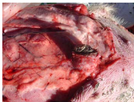
Figura 6 - Onfalite

De referir ainda que ocorreram 2 mortes no grupo Controle, sendo a causa de morte de um dos leitões uma onfalite.