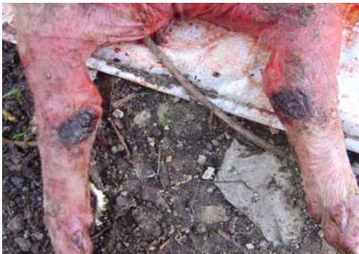
Figura 5 – Lesões dos membros posteriores de leitão do grupo Controle