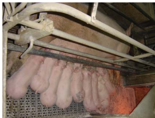
Figura 4 – Maternidade com Mistral ®