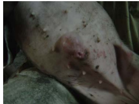
Figura 6 – Onfalite em leitão do grupo Controle